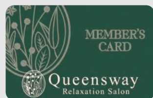
●プリペイド施術券